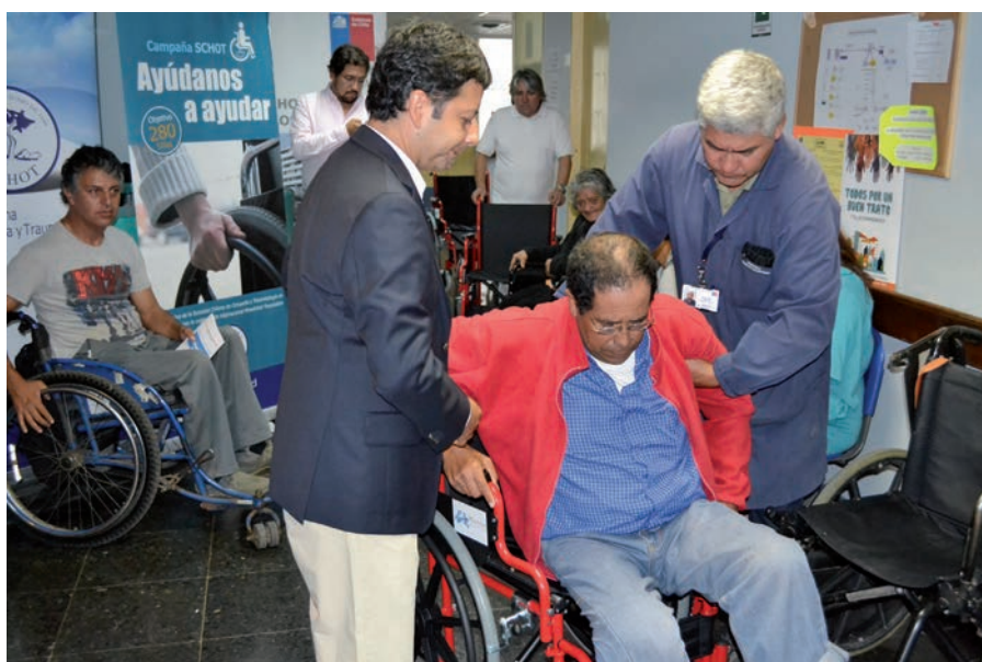
Pacientes del HCVB recibiendo sus nuevas sillas

Al finalizar su intervención, el representante de la SCHOT dejó un importante mensaje a los pacientes: "Espero que utilicen las sillas y me gustaría que si al fin de los ciclos que ustedes las dejen de usar, nos hagan un favor, busquen un buen destino para ellas y si todavía funcionan bien, busquen a la persona idónea para seguir usando este elemento y así nos vamos a ir ayudando entre todos".